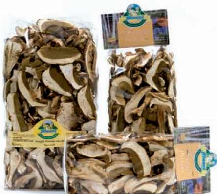
BUSTE PERSONALIZZABILI EXTRA / SPECIALI / COMMERCIALI gr.50/gr.100/gr.200/gr.500