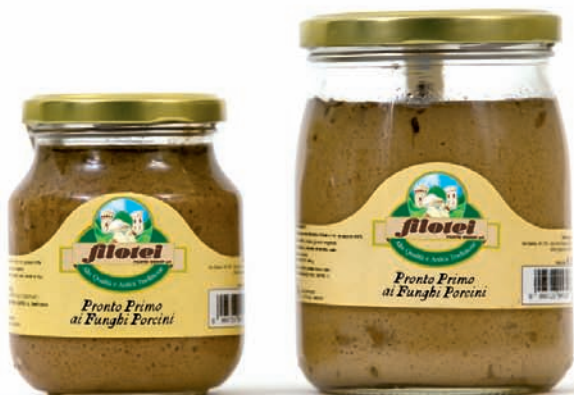
PRONTO PRIMO AI FUNGHI PORCINI gr.250/gr.500

Suzzicante e sfizioso... il Pronto Primo Filotei è la risposta alla voglia di un primo piatto speciale, semplice e veloce da preparare, dal sapore delicato e dall'odore sublime dei funghi porcini.