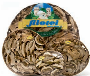
CESTINI EXTRA gr.20/gr.30/gr.50/gr.100/gr.200/gr.300/gr.500

P restigiose confezioni per conservare tutto il sapore di questi preziosi porcini.