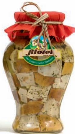
PORCINI TAGLIATI gr.280/gr.650 ANFORA da Kg.1,5/Kg.3