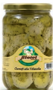
CARCIOFI ALLA VILLANELLA gr.650/Kg.3