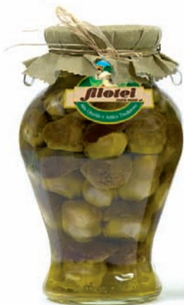
PORCINI INTERI TESTAROSSA gr.280/gr.650 ANFORA da Kg.1,5/Kg.3

D erivante da una lavorazione attenta alle indicazioni dell'antica e preziosa ricetta Filotei, vengono prodotti i funghi porcini in olio e fantasie di funghi, regalando antipasti e contorni dal piacere unico e irripetibile.