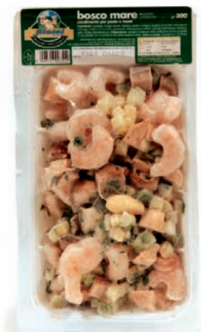
BOSCO MARE gr.300

T utta la qualità, il sapore e l'unicità dei prodotti Filotei pronti da gustare in qualsiasi momento.