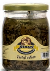
TARTUFI A FETTE gr.75/gr.180/gr.500

La ricerca dei Tartufi più pregiati e la specifica lavorazione dell'Azienda Filotei Group permette di mantenere inalterato tutto il profumo, l'aroma e le qualità organolettiche del prezioso tubero. Proponiamo squisite preparazioni come creme, condimenti gastronomici e carpaccio.