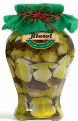
PORCINI TAGLIATI TESTAROSSA gr.280/gr.650 ANFORA da Kg.1,5/Kg.3