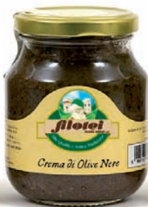
CREMA DI OLIVE NERE gr.140/gr.250/gr.900