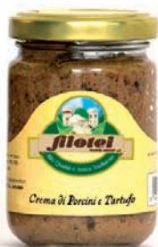
CREMA DI PORCINI E TARTUFO gr.140/gr.500