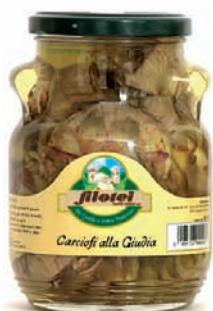
CARCIOFI ALLA GIUDIA gr.300/gr.540/Kg.1,6/Kg.3

L'ampio assortimento delle lavorazioni dei nostri carciofi permette di preparare antipasti, contorni leggeri e appetitose insalate... con il loro sapore delicato e la loro alta digeribilità, i carciofi Filotei mantengono tutto il gusto della tradizione.