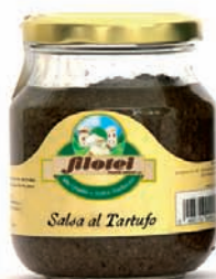
SALSA AL TARTUFO gr.75/gr.250/gr.900

I deali per condire primi piatti o insaporire carni di ogni genere, ottime su crostini e bruschette, le salse e le creme Filotei ai tartufi e ai funghi, mixano i preziosi sapori del sottobosco alla voglia di una cucina esclusiva.