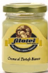
CREMA AL TARTUFO BIANCO gr.75