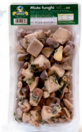
MISTO FUNGHI gr.300