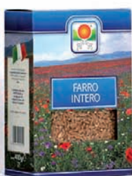
FARRO INTERO gr.500