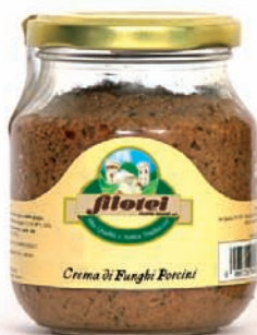
CREMA DI FUNGHI PORCINI gr.75/gr.250/gr.900