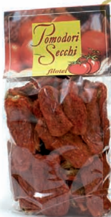
POMODORI SECCHI gr.300