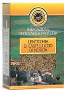
LENTICCHIA DI CASTELLUCCIO DI NORCIA gr.500