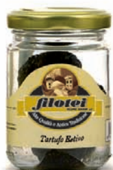
TARTUFO ESTIVO gr.35/gr.60