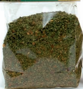
PICCANTINA SIBILLINA gr.100