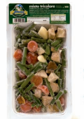
MISTO TRICOLORE gr.300