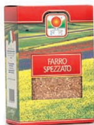
FARRO SPEZZATO gr.500

La Filotei Group srl e la Cooperativa del Castelluccio di Norcia propongono legumi, cereali e una fantasia di zuppe per pasti completi e saporiti.