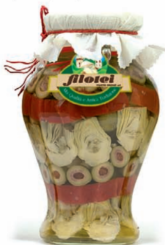
ANTIPASTO TRIS gr.280/gr.650 ANFORA Kg.1,5