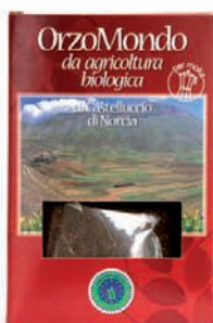
ORZO MONDO gr.500