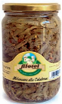
MELANZANE ALLA CALABRESE gr.650/Kg.3