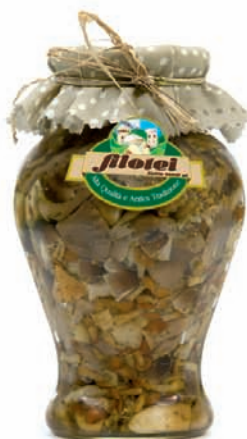
FANTASIA DI FUNGHI gr.280/gr.650/Kg.3 ANFORA da Kg.1,5