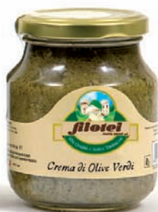
CREMA DI OLIVE VERDI gr.140/gr.250/gr.900