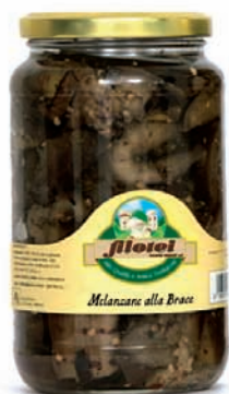
MELANZANE ALLA BRACE gr.650/Kg.3 ANFORA Kg.1,5

F rutto di ricette tradizionali, l'azienda Filotei offre una vasta scelta di verdure ideali per aperitivi, antipasti e stuzzicanti contorni, per chi ama mangiare bene.