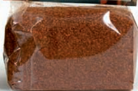
PEPERONCINO FRANTUMATO gr.100