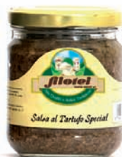
SALSA AL TARTUFO SPECIAL gr.140/gr.180/gr.500