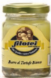
BURRO AL TARTUFO BIANCO gr.75/180