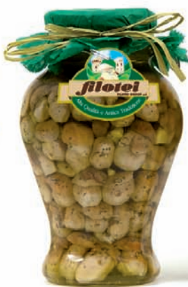
PORCINI INTERI gr.280/gr.650 ANFORA da Kg.1,5/Kg.3