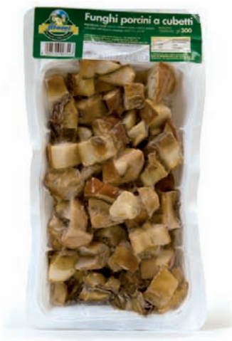
FUNGHI PORCINI A CUBETTI gr.300