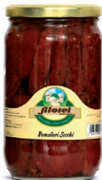
POMODORI SECCHI gr.300/gr.650/Kg.3 ANFORA Kg.1,5