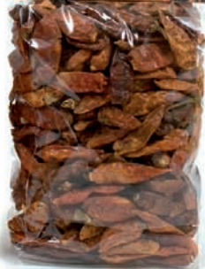
PEPERONCINO INTERO gr.100