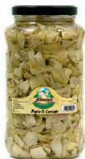
FOGLIE DI CARCIOFO Kg.3