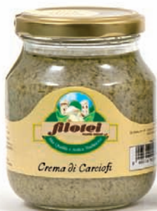
CREMA DI CARCIOFI gr.140/gr.250/gr.900

L'uso di verdure, spezie ed odori delle nostre terre ha permesso all'Azienda Filotei Group di ideare squisite creme e salse adatte a tutti gli utilizzi che liberano la creatività e la fantasia in cucina.