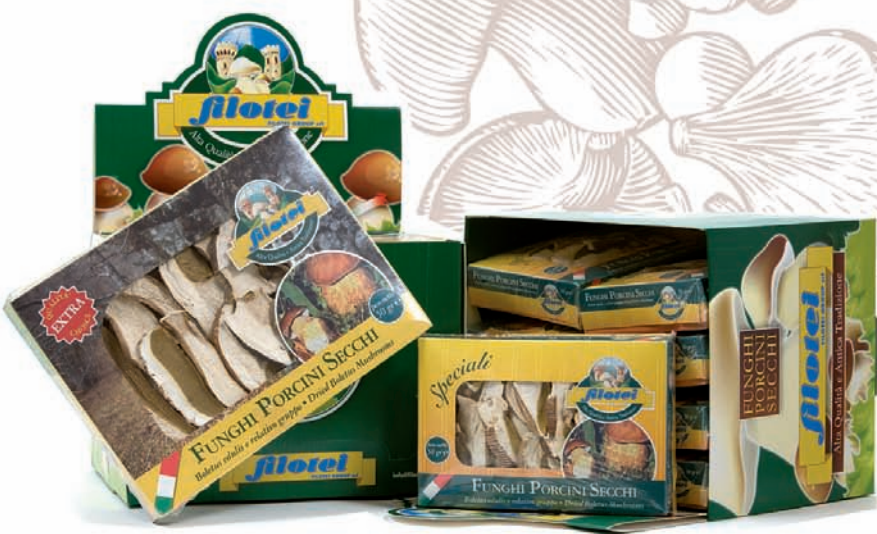
ASTUCCI SPECIALI EXTRA gr.30/gr.50/gr.100