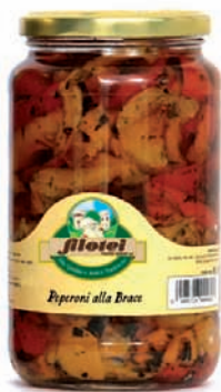
PEPERONI ALLA BRACE gr.650